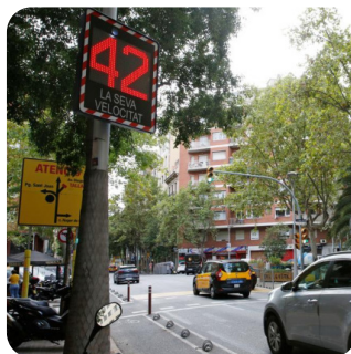
Radares pedagógicos. Carteles luminosos informativos

Se aplica en Barcelona el programa municipal Protegim les escoles haciendo de los entornos escolares lugares seguros y saludables : en una fase inicial en 12 centros educativos se ha conseguido pacificar el tráfico en el entorno aplicando la limitación de velocidad de 30 km/h .