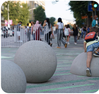
Entornos escolares más seguros protegiendo los colectivos más vulnerables