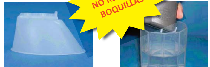
Boquilla T. Pasivo

Gracias a su memoria interna es capaz de recoger hasta 800 mediciones