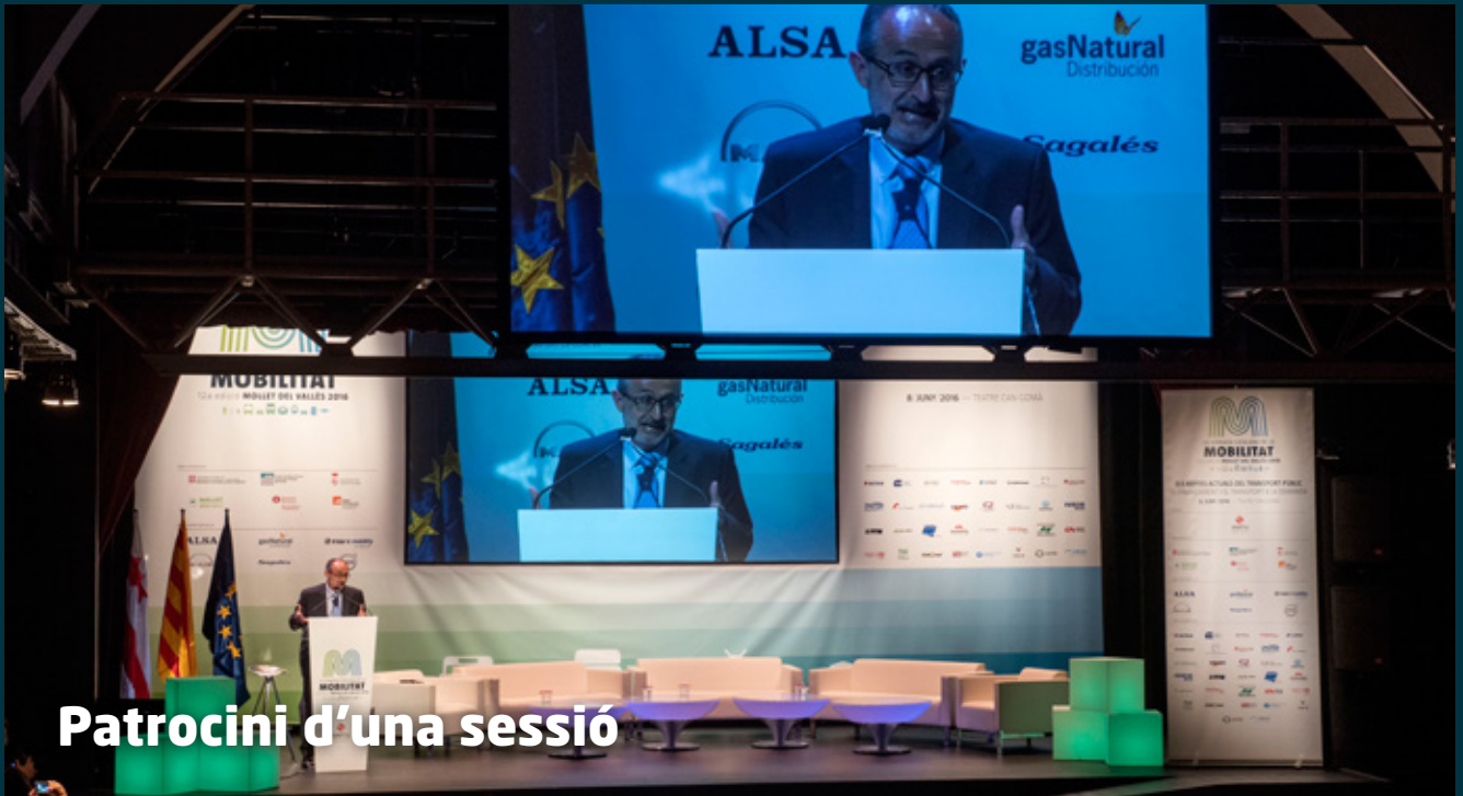
Patrocini d'una sessió