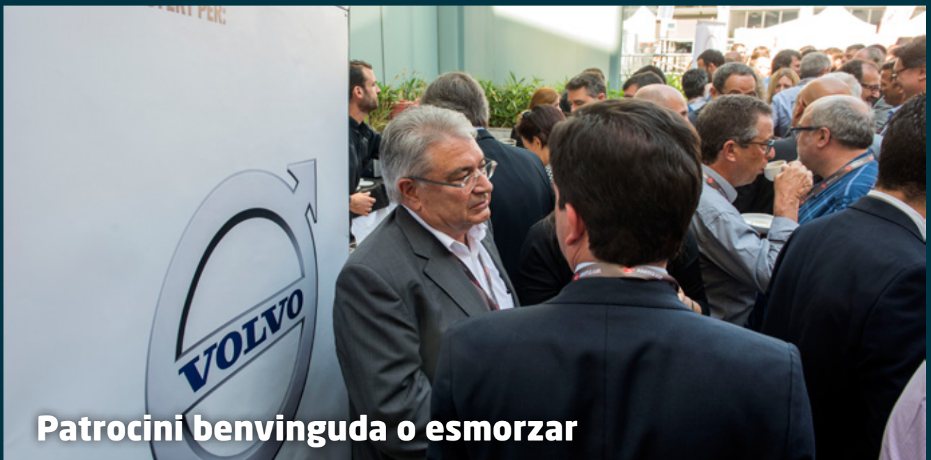
Patrocini benvinguda o esmorzar