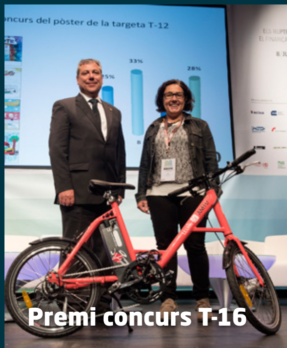
Premi concurs T-16